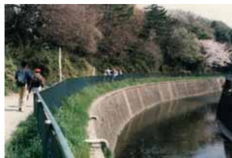
白子川の春の風景(和光市HPより)