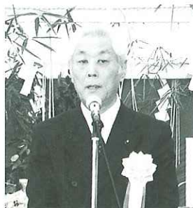
理事長のあいさつ