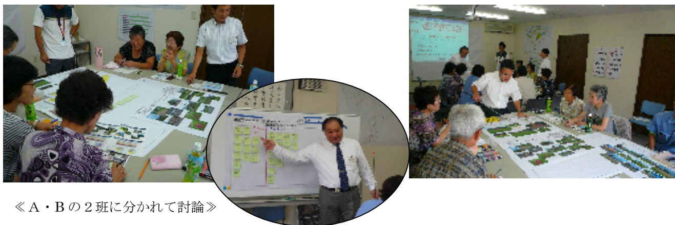
《A・Bの2班に分かれて討論》