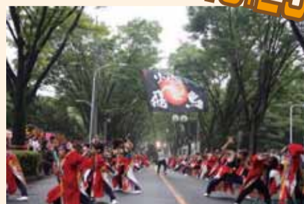
リゾン鳴子会 飛鳥