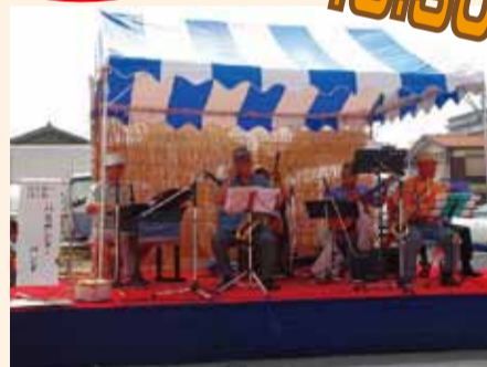
バカモンドバンド